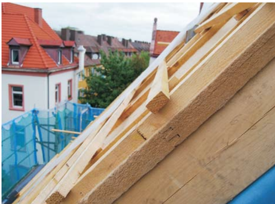
Istota s garanciou