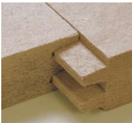
Hofafest UD 60mm

Vďaka veľmi dobrej hodnote S_D (ekvivalentnej difúznej hrúbke) - pohybujúcej sa od 0,09 m do 0,3 m, sú panely Hofafest UD vhodné do všetkých difúzne otvorených konštrukcií. Použitie panelov ako jednej z vrstiev vonkajšieho opláštenia konštrukcií, kde je izolačná vrstva umiestnená medzi krokvmi alebo medzi stĺpkami rámovej konštrukcie obvodových stien zabezpečuje aj dostatočnú pevnosť konštrukcie. Ako dočasné debnenie striech alebo obvodových stien môže byť vrstva panelov Hofafest UD vystavená vonkajším poveternostným podmienkam aj niekoľko týždňov.